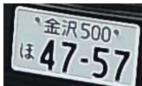
スナップショットして解析