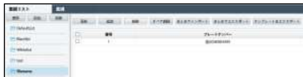
ストーカーリストと照合